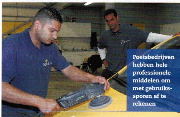
Poetsbedrijven hebben hele professionele middelen om met gebruikssporen af te rekenen