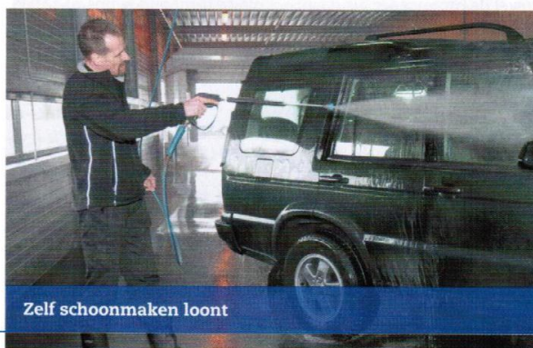
Zelf schoonmaken loont