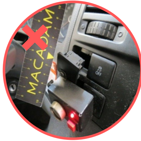
Niet originele gemonteerde accessoires.