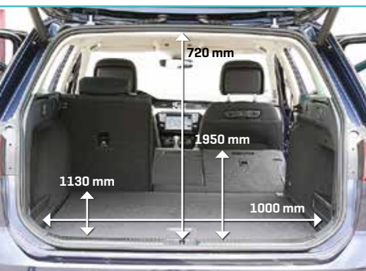
▲ Volkswagen Passat Variant Tegen een laadvolume van 650 tot 1780 liter heeft geen enkele middenklasser iets in te brengen.