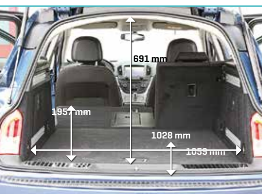
▲ Opel Insignia Sports Tourer Met een inhoud van 540 tot 1530 liter is het laadruim van de Opel niet overbemeaten. Een skiluis is optioneel.