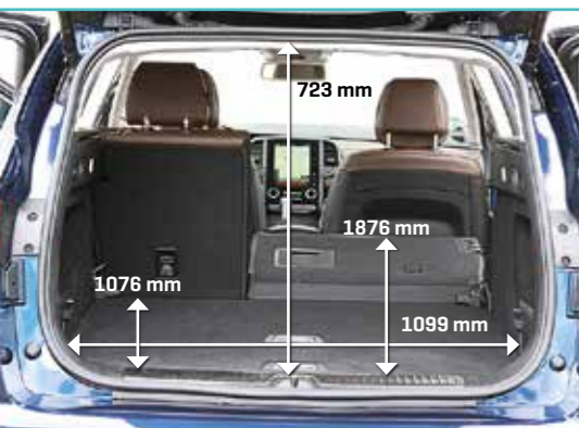
▲ Renault Talisman Estate Er past 572 tot 1681 liter achter in de Renault. Prettig bij het in- en uitladen is de lage tildrempel.