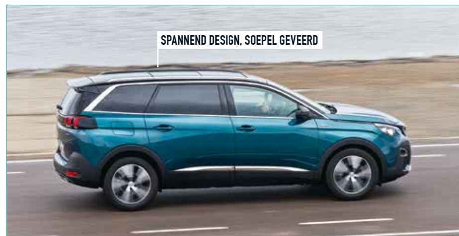
SPANNEND DESIGN, SOEPEL GEVEERD

◀ Bij de Ambition-uitvoering worden de voor- en achterportieren beschermd met een stootrandje.