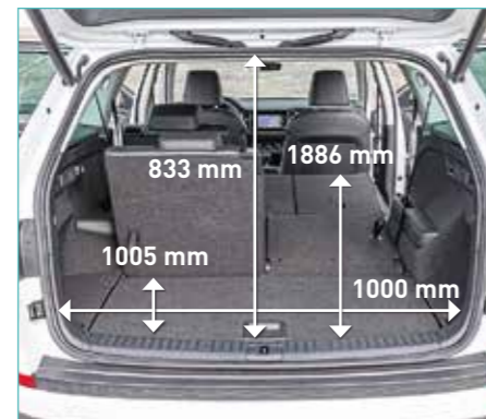
649 kilo aan vracht en volk gaat er in de Skoda Kodiaq. Zijn bagageruimte rekt van 650 tot 2065 liter.