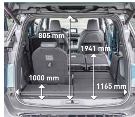
In de grote bagageruimte van de 5008 past 780 tot 1940 liter. Alle koffers en passagiers samen mogen 556 kilo wegen.