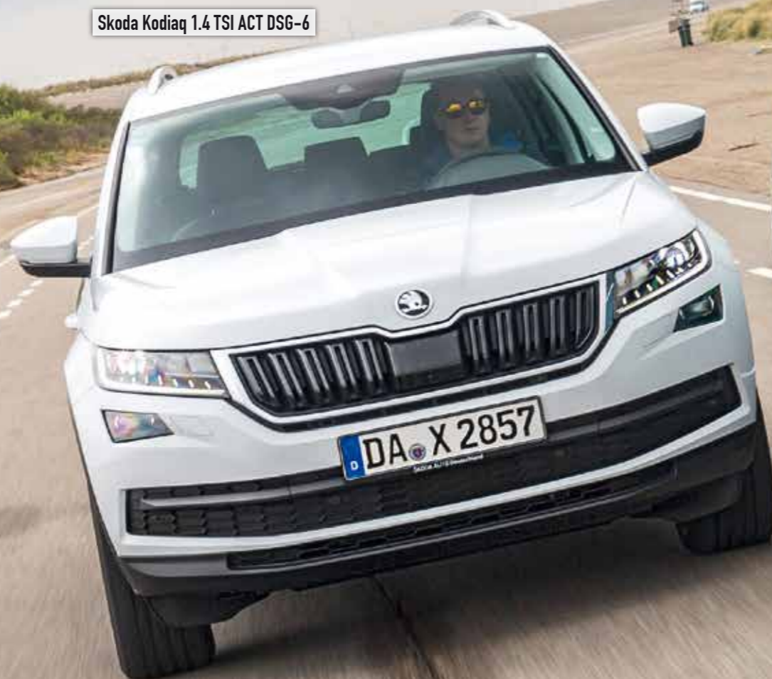
Skoda Kodiaq 1.4 TSI ACT DSG-6