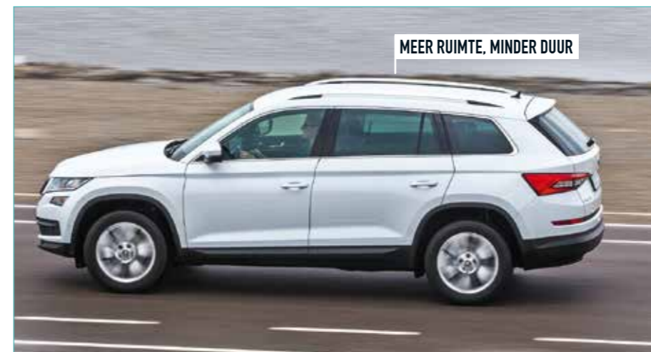
MEER RUIMTE, MINDER DUUR